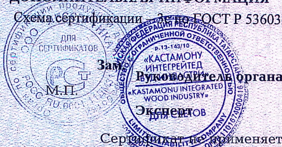
Схема сертификации З по ГОСТ Р 53603-2009.